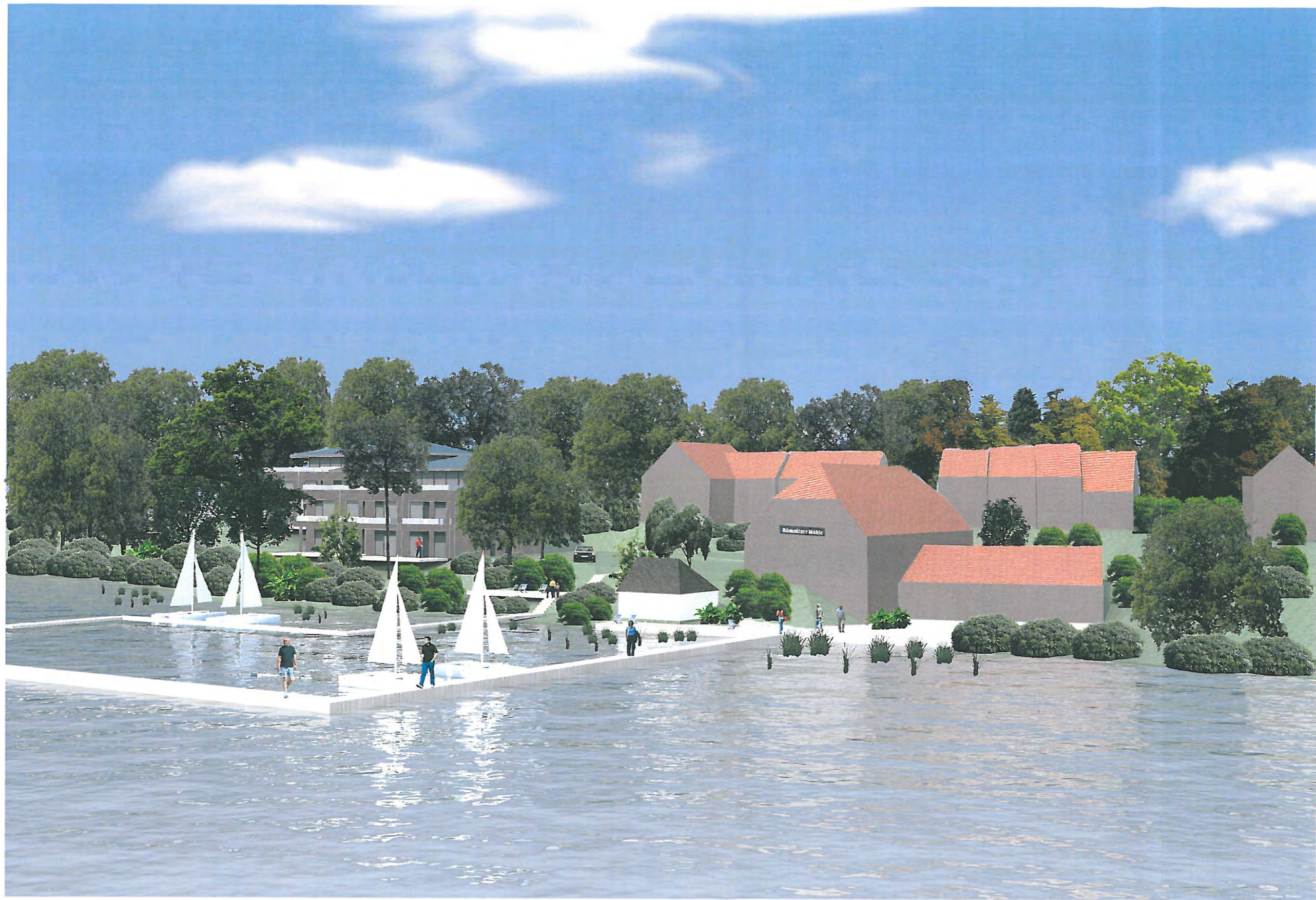
Neubau Ferienhäuser Römnitz/ Ratzeburger See

Büro Unna Westring 10, D-59423 Unna Tel.: 02303-96868-0 Fax: 02303-96868-19 www.architekt-deterding.de architekt-deterding@t-online.de