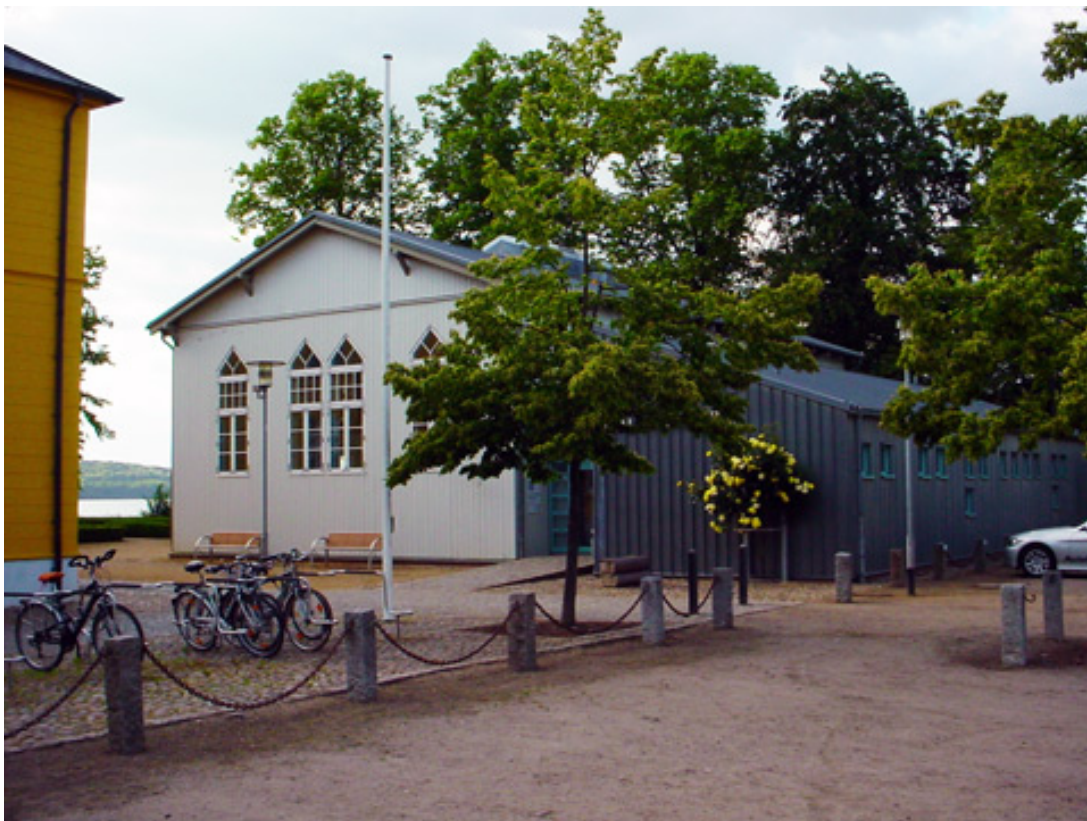
Abbildung 1: Das landschaftlich reizvolle und bisher zu selten genutzte Ensemble direkt am großen Ratzeburger See mit Rathaus, Innenhof, Sporthalle und Bootshaus der Ruderriege würde in Gänze einer öffentlichkeitswirksamen Nutzung zugeführt

Derzeit laufen die vorbereitenden Untersuchungen für mögliche Maßnahmen im Rahmen des Städtebauförderprogramms „Kleine Städte und Gemeinden – überörtliche Zusammenarbeit und Netzwerke“, in das die Stadt Ratzeburg aufgenommen wurde. Zu den Schwerpunkten des Programms gehören unter anderem die „Daseinsvorsorge“ sowie die „Sicherung der Infrastruktur“ der Stadt. Die vorliegende Konzeptskizze versteht sich als Beitrag zu den Überlegungen in genau diesen beiden Bereichen.