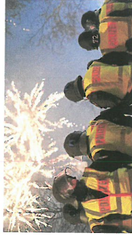
Polizei in Hannover in einem Gebiet, in dem Böllern verboten ist.

Auch die Böllerverbotszone in Hannover - ein weiträumiger innerstädtischer Bereich - wird erneut eingerichtet, um Verletzungen in Menschenmassen zu vermeiden.