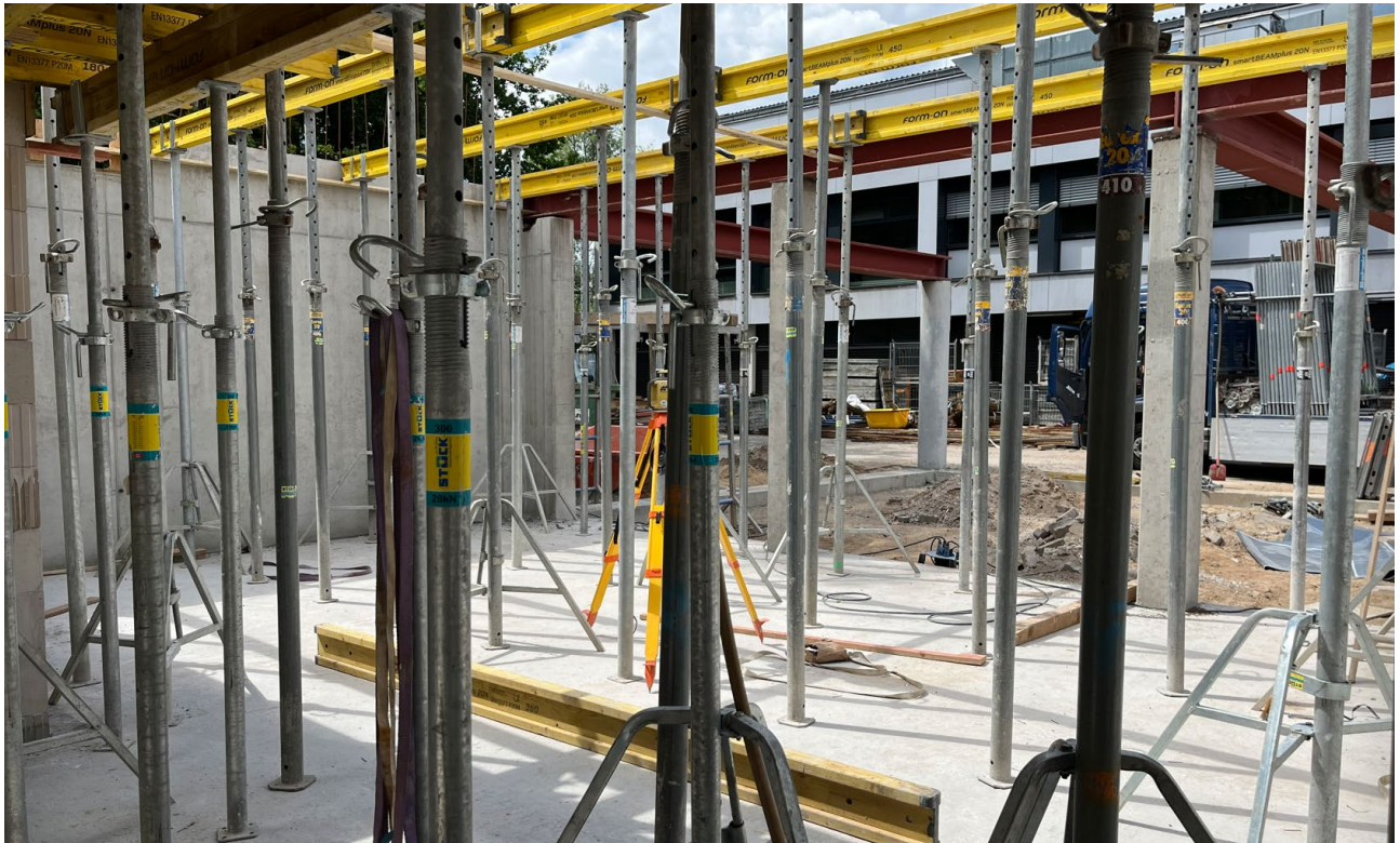
Abbildung 5: Neubau Wohntrakt