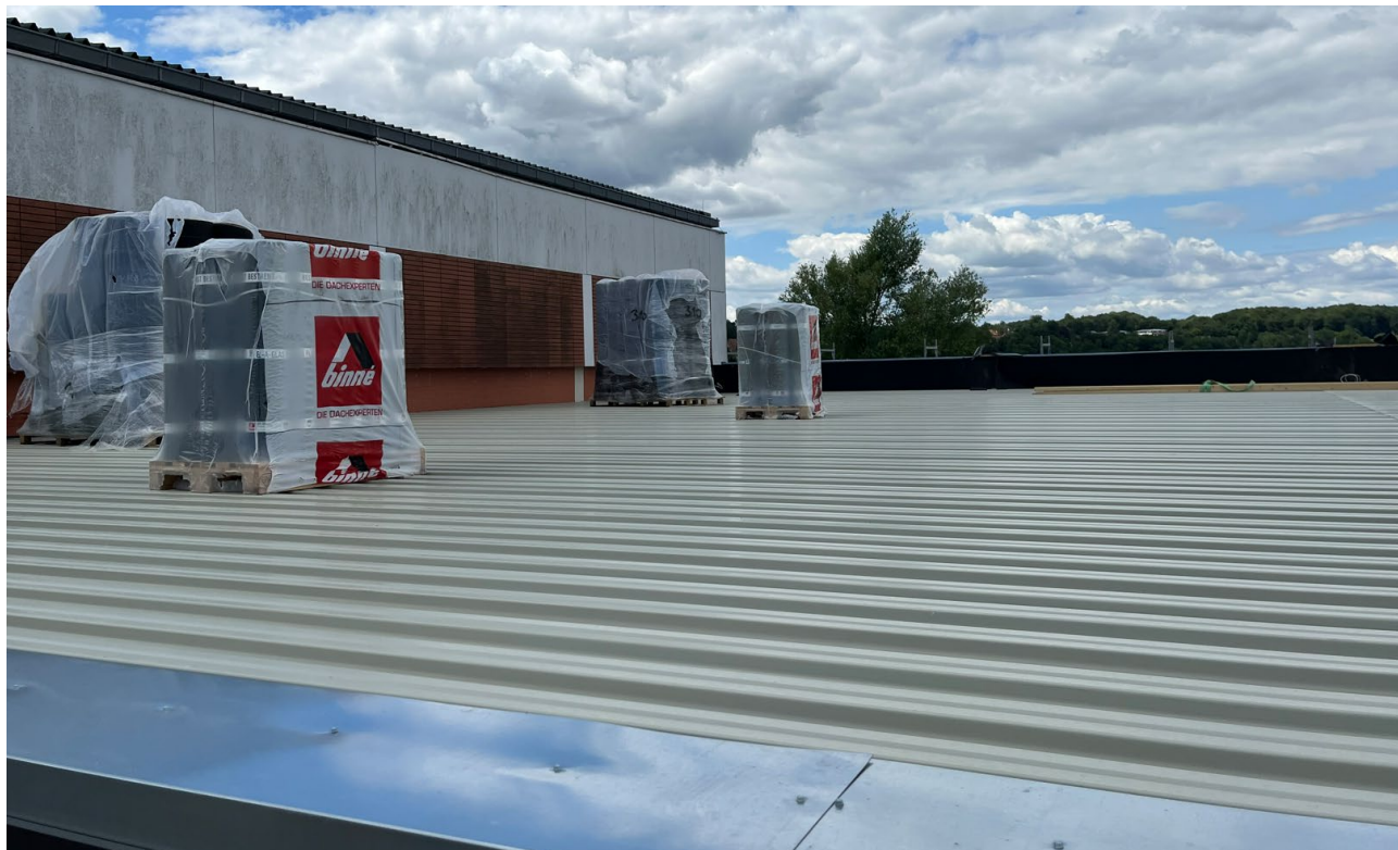
Abbildung 4: Dach Sporttrakt