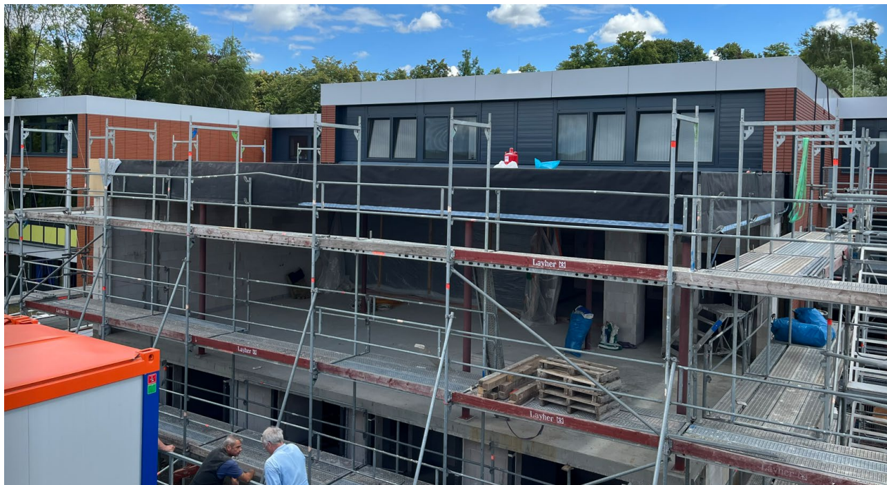
Abbildung 3: Neubau und Umbau Speisesaal