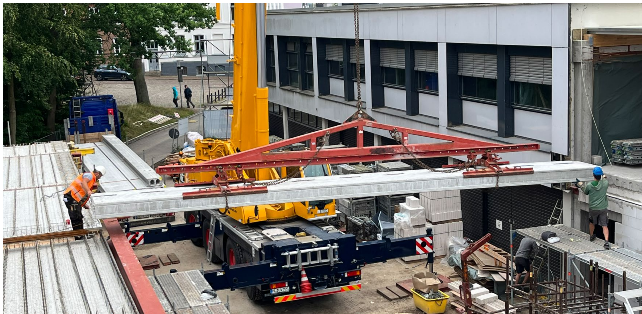
Abbildung 1: Verbindung zwischen Wohntrakt und Sporttrakt

In diesem Abschnitt werden regelmäßig Bilder und Eindrücke aus der Planung bzw. dem Bauvorhaben festgehalten. Nachfolgend wird der Baufortschritt nach den Abbrucharbeiten dargestellt: