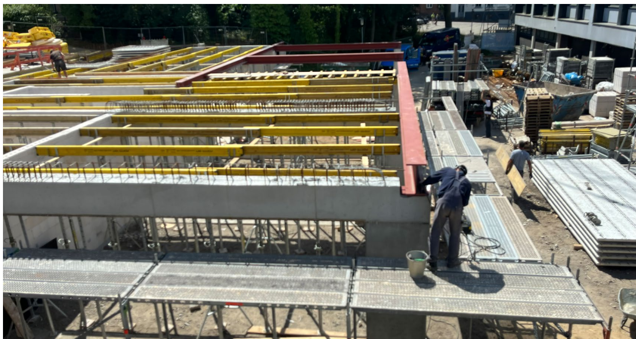
Abbildung 2: Neubau Wohntrakt