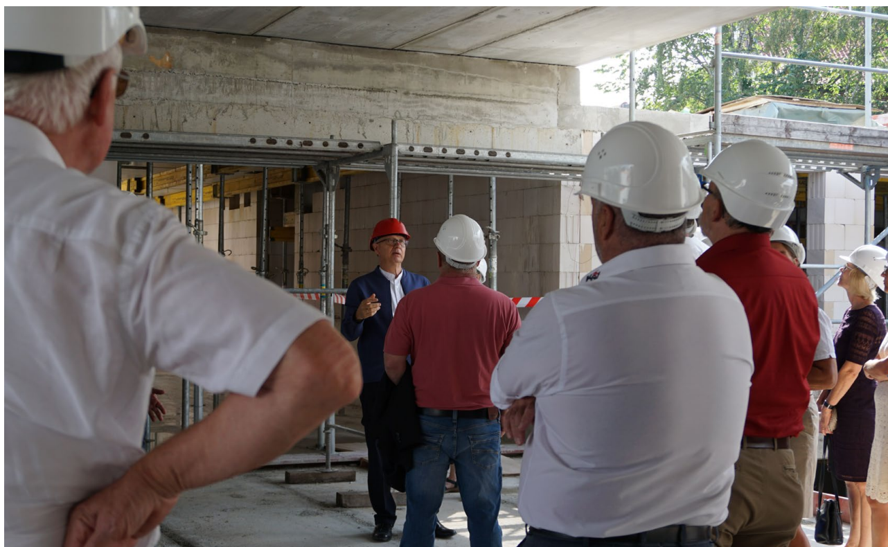
Abbildung 6: Baustellenführung beim Richtfest