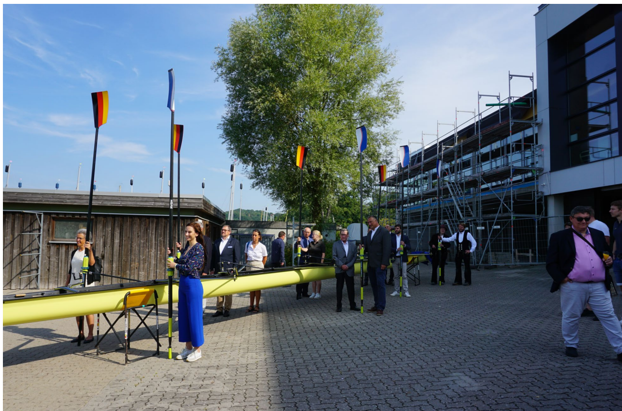
Abbildung 5: Taufe des Achters