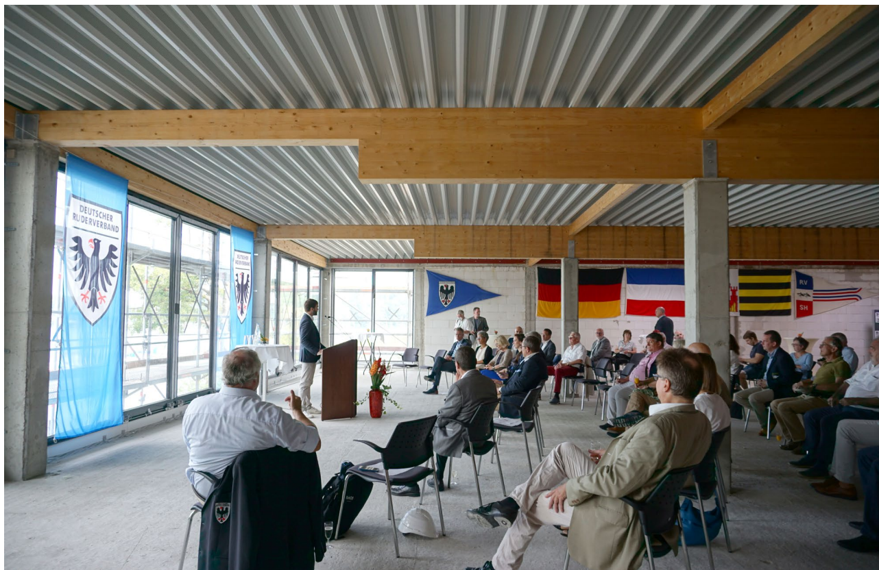
Abbildung 4: Eröffnungsrede Richtfest