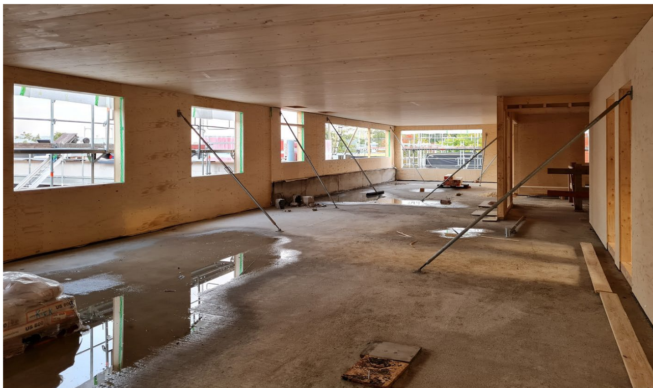
Abbildung 3: Obergeschoss des Ostflügels Innenansicht