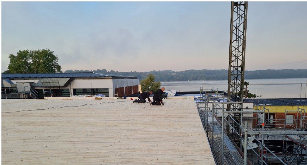
Abbildung 1: Befestigungsarbeiten an der Decke im Obergeschoss des Ostflügels

In diesem Abschnitt werden regelmäßig Bilder und Eindrücke aus der Planung bzw. dem Bauvorhaben festgehalten. Nachfolgend wird der Baufortschritt nach den Abbrucharbeiten dargestellt: