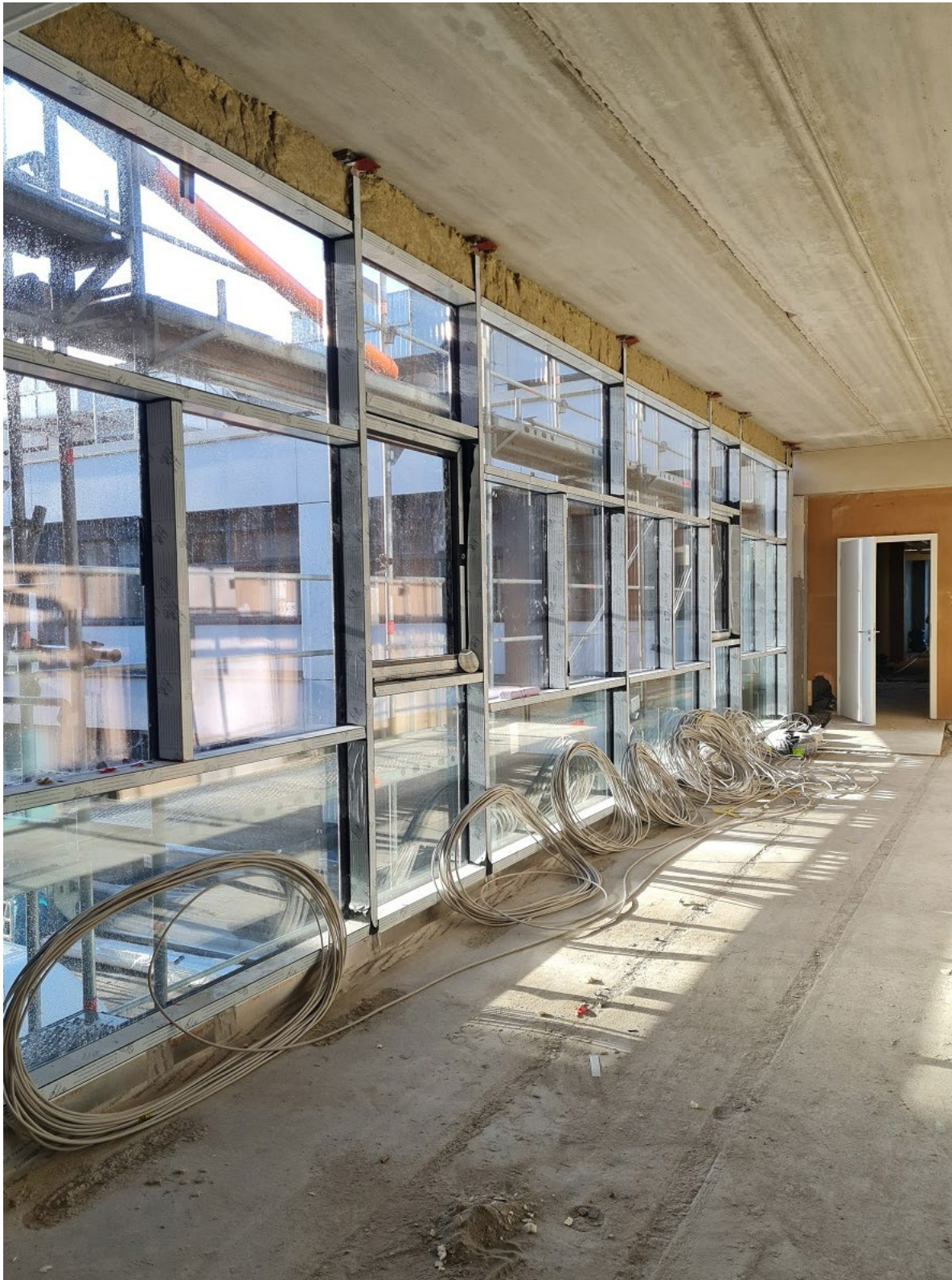
Abbildung 5: Übergang Sporttrakt