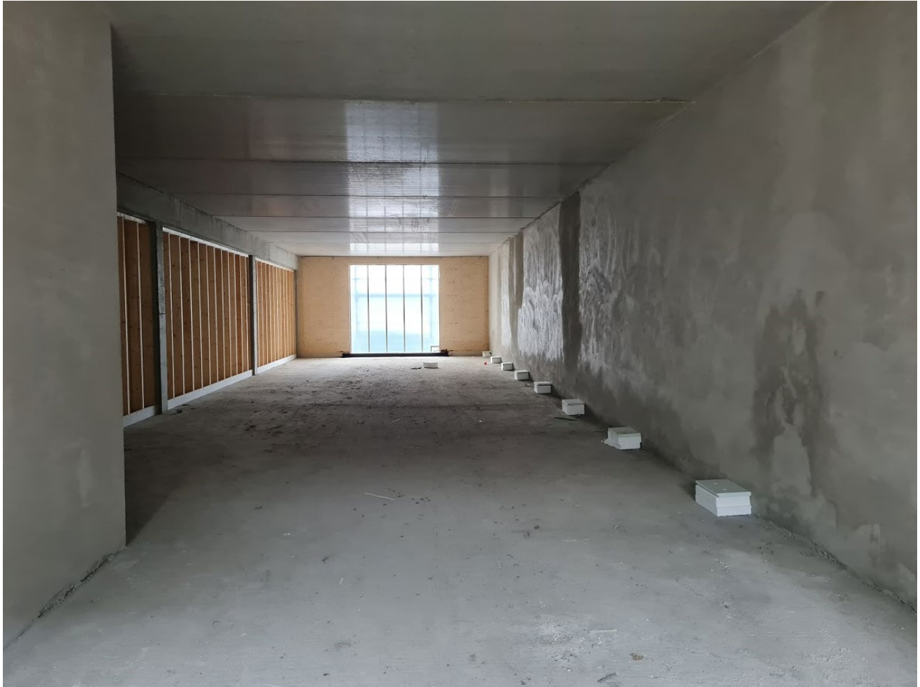
Abbildung 2: Innenbereich Sporttrakt