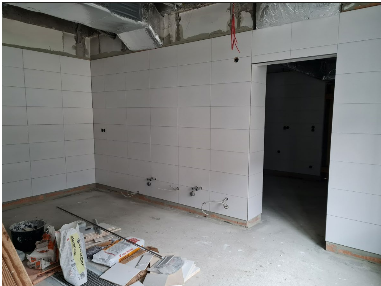
Abbildung 1: Fliesenarbeiten

In diesem Abschnitt werden regelmäßig Bilder und Eindrücke aus der Planung bzw. dem Bauvorhaben festgehalten. Nachfolgend wird der Baufortschritt nach den Abbrucharbeiten dargestellt: