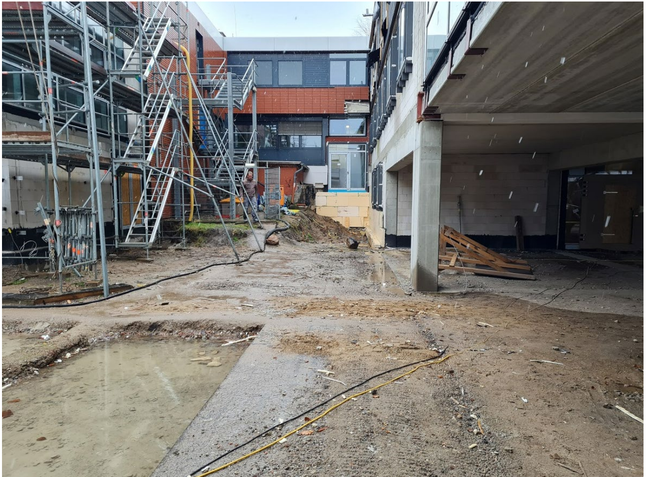
Abbildung 3: Übergang Sporttrakt und Außenbereich Mensa