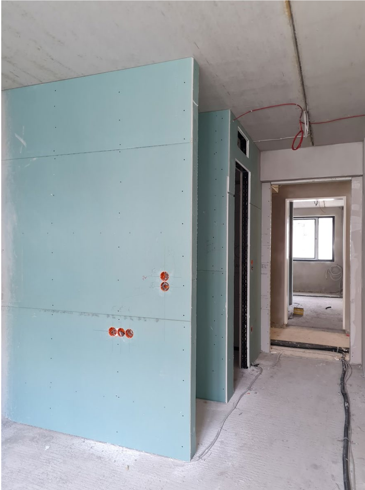
Abbildung 4: Innenausbau