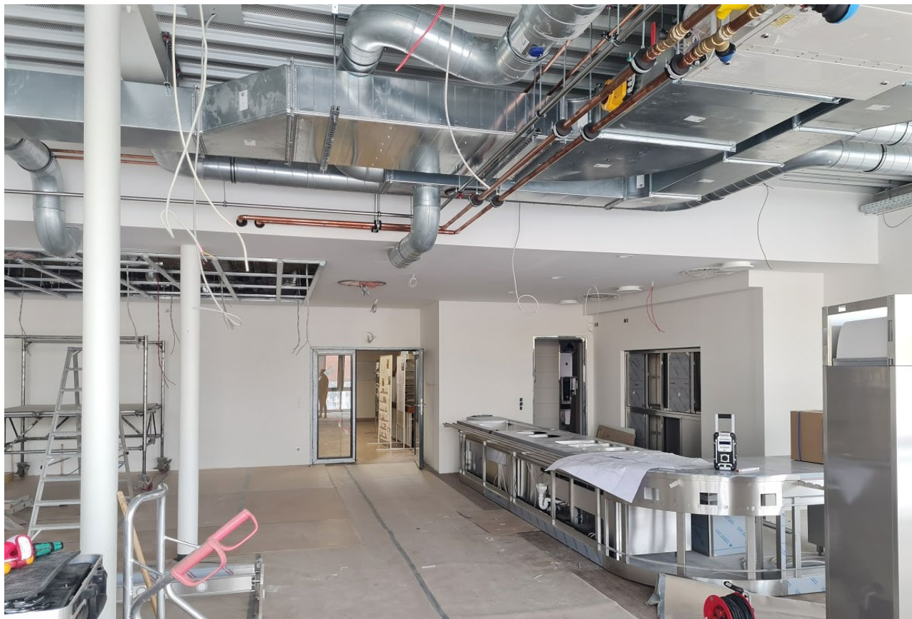
Abbildung 3: Ausgabe Mensa