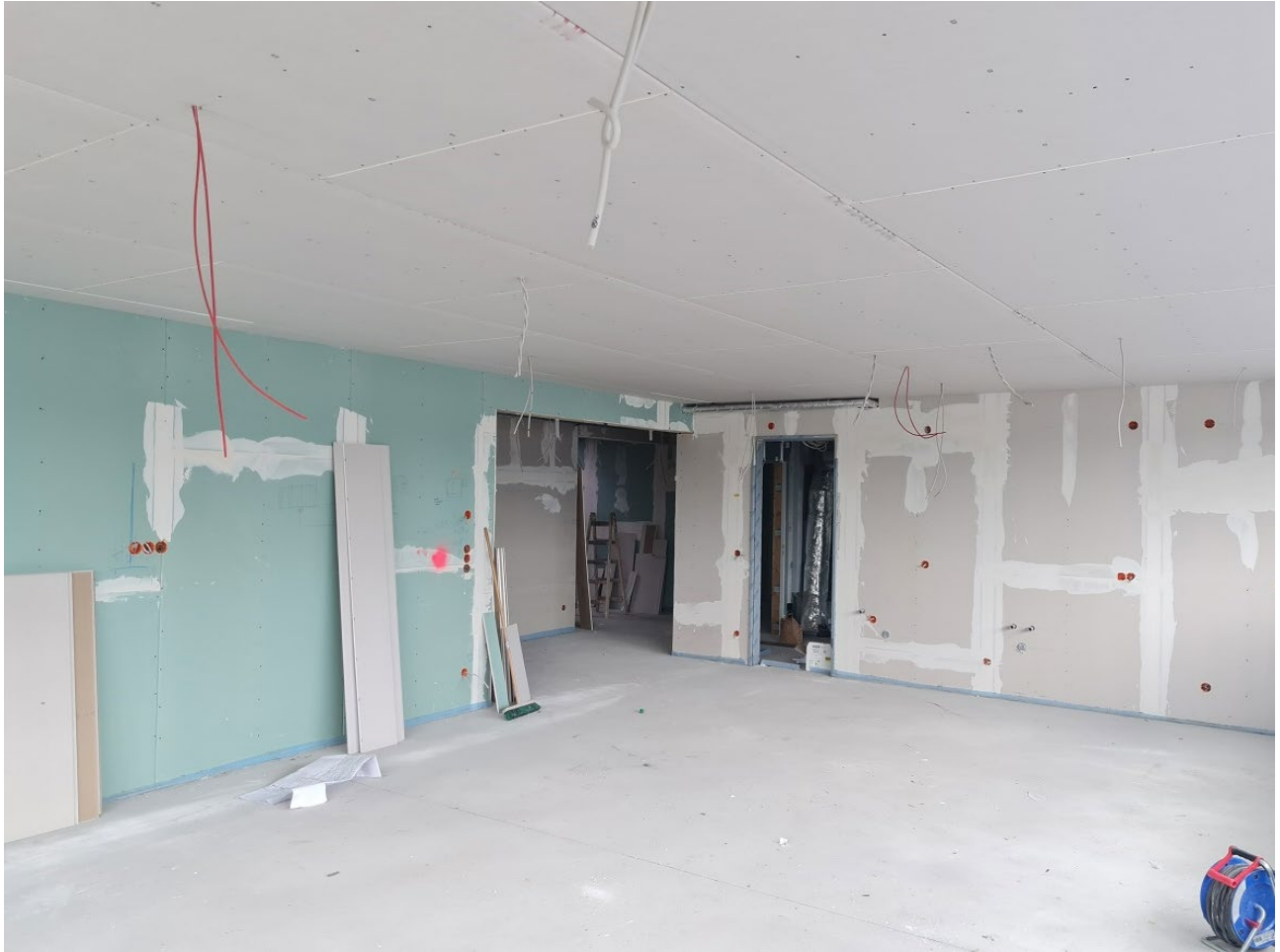
Abbildung 5: Innenausbau Trockenbau