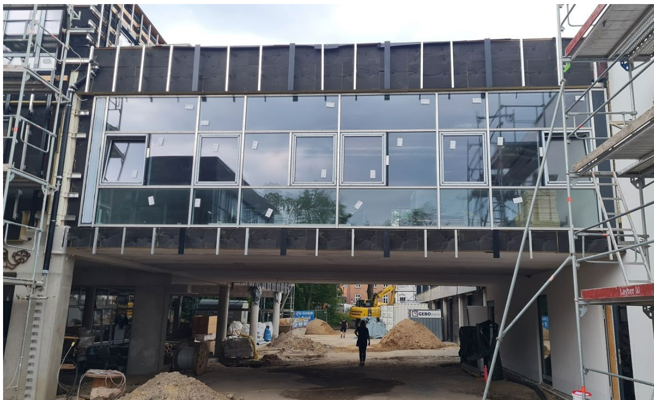
Abbildung 4: Crossover