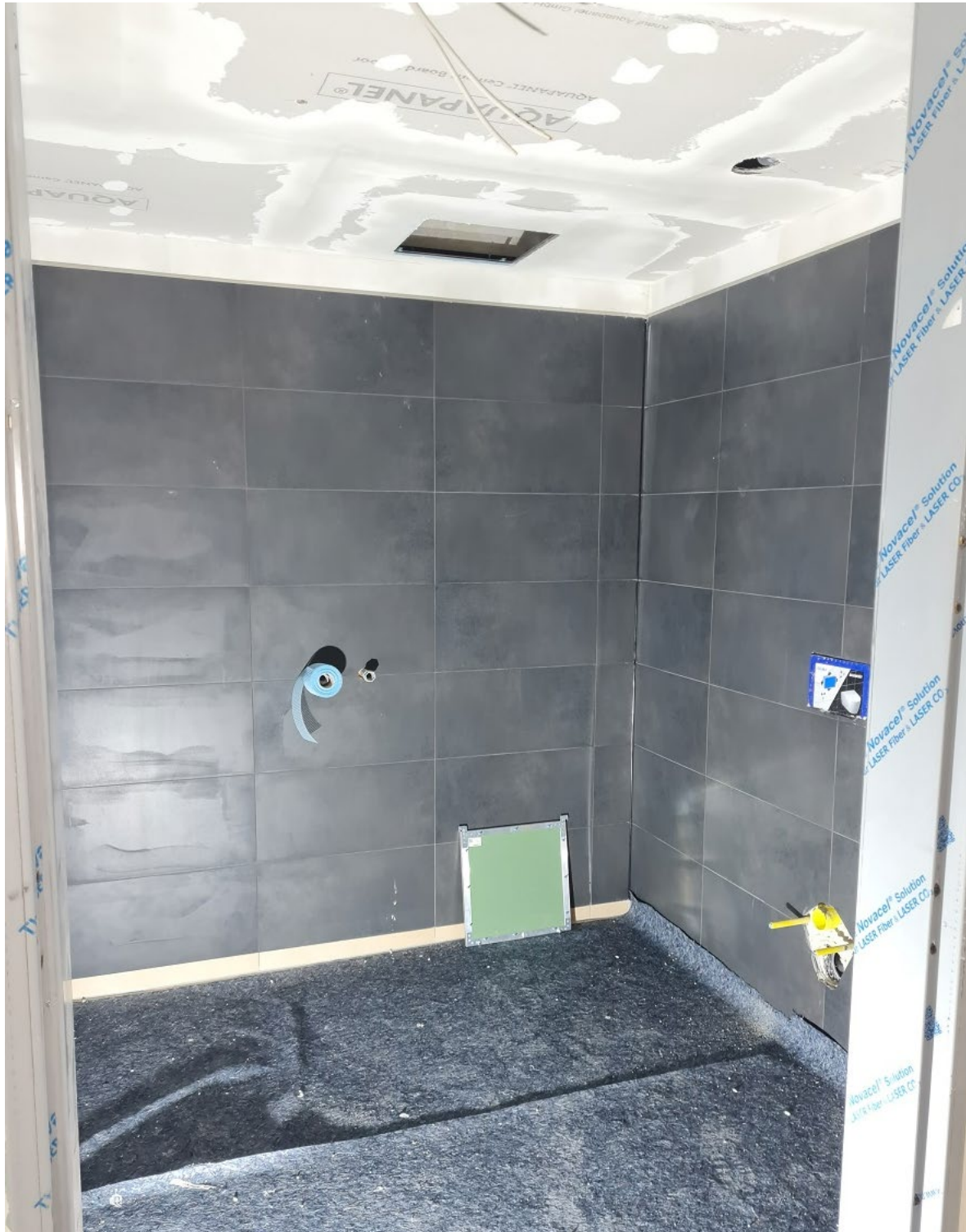
Abbildung 6: Fliesenarbeiten