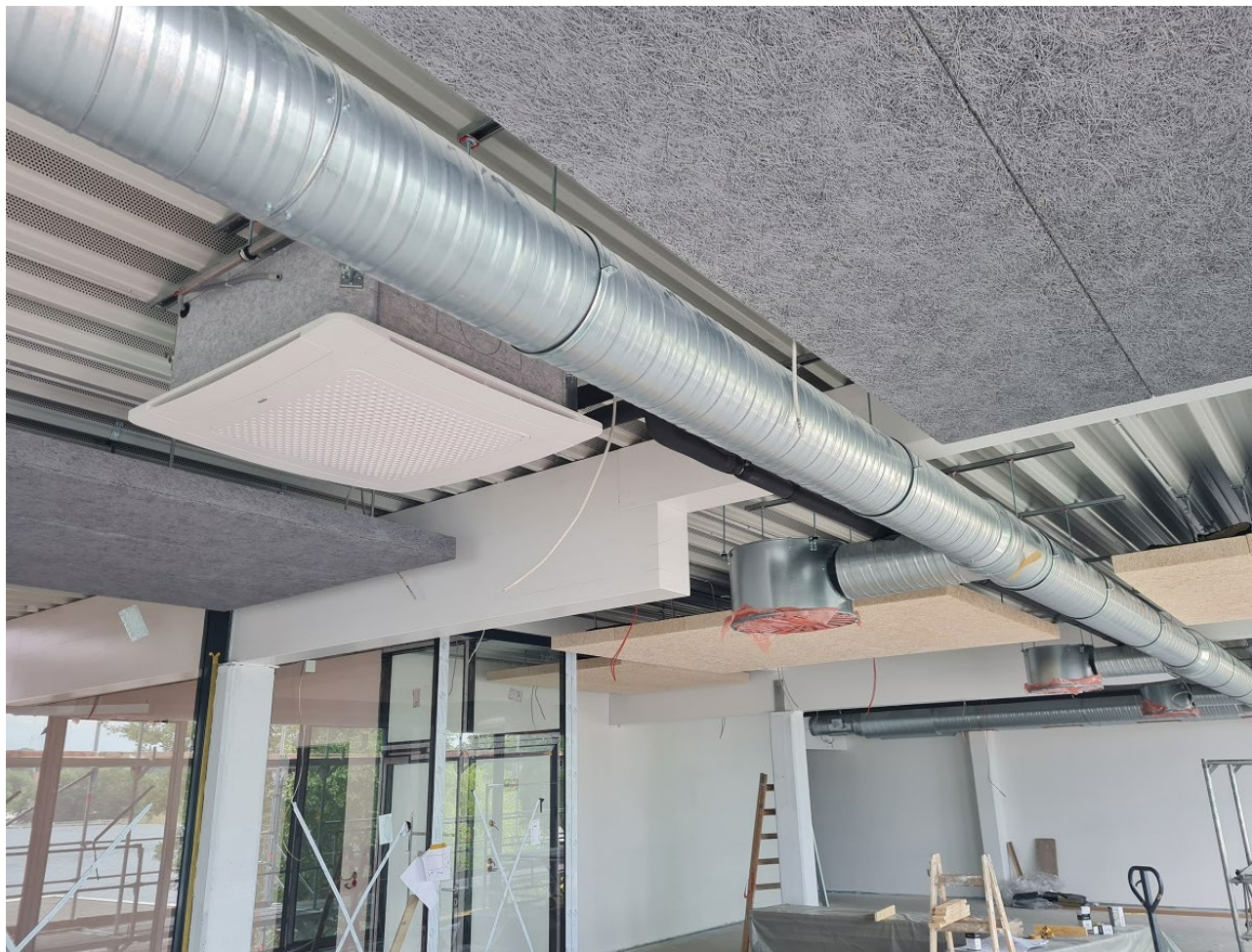
Abbildung 1: Einbau Lüftungssystem

In diesem Abschnitt werden regelmäßig Bilder und Eindrücke aus der Planung bzw. dem Bauvorhaben festgehalten. Nachfolgend wird der Baufortschritt nach den Abbrucharbeiten dargestellt: