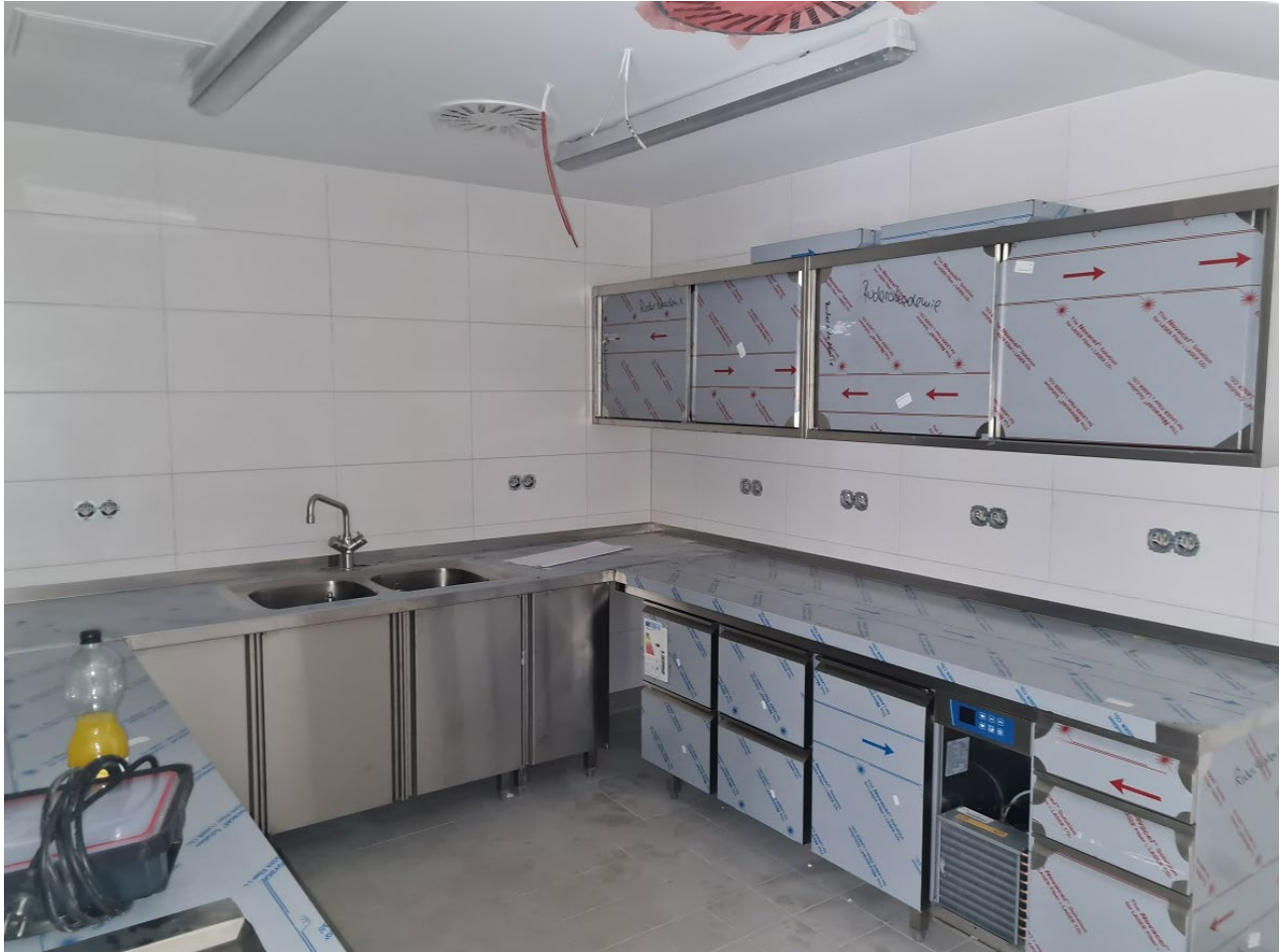
Abbildung 2: Einbau Küche Mensa