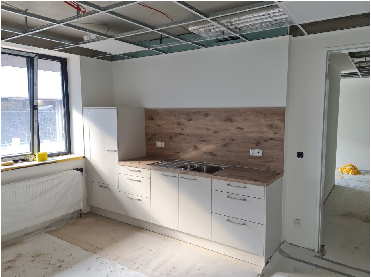
Abbildung 7: Einbauküche