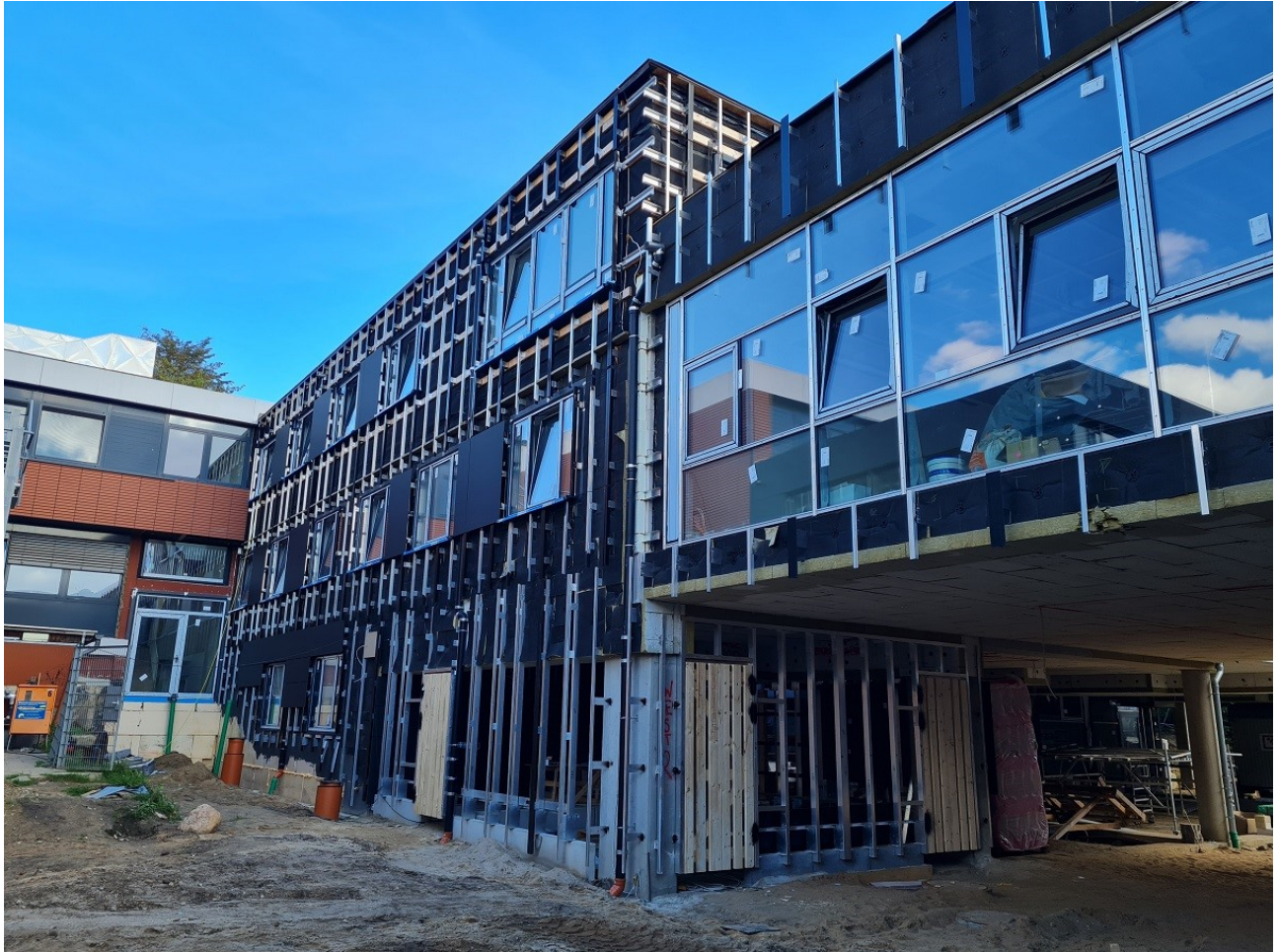
Abbildung 2: Ansicht Unterkonstruktion Fassade