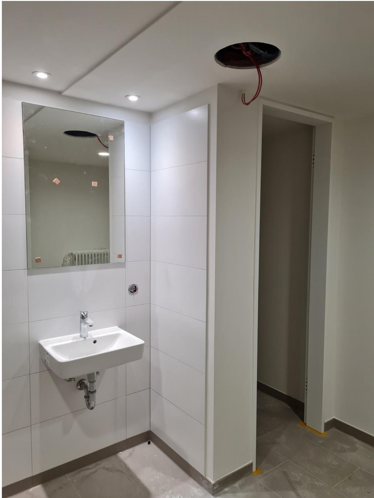
Abbildung 8: Zimmerfertigstellungsstand