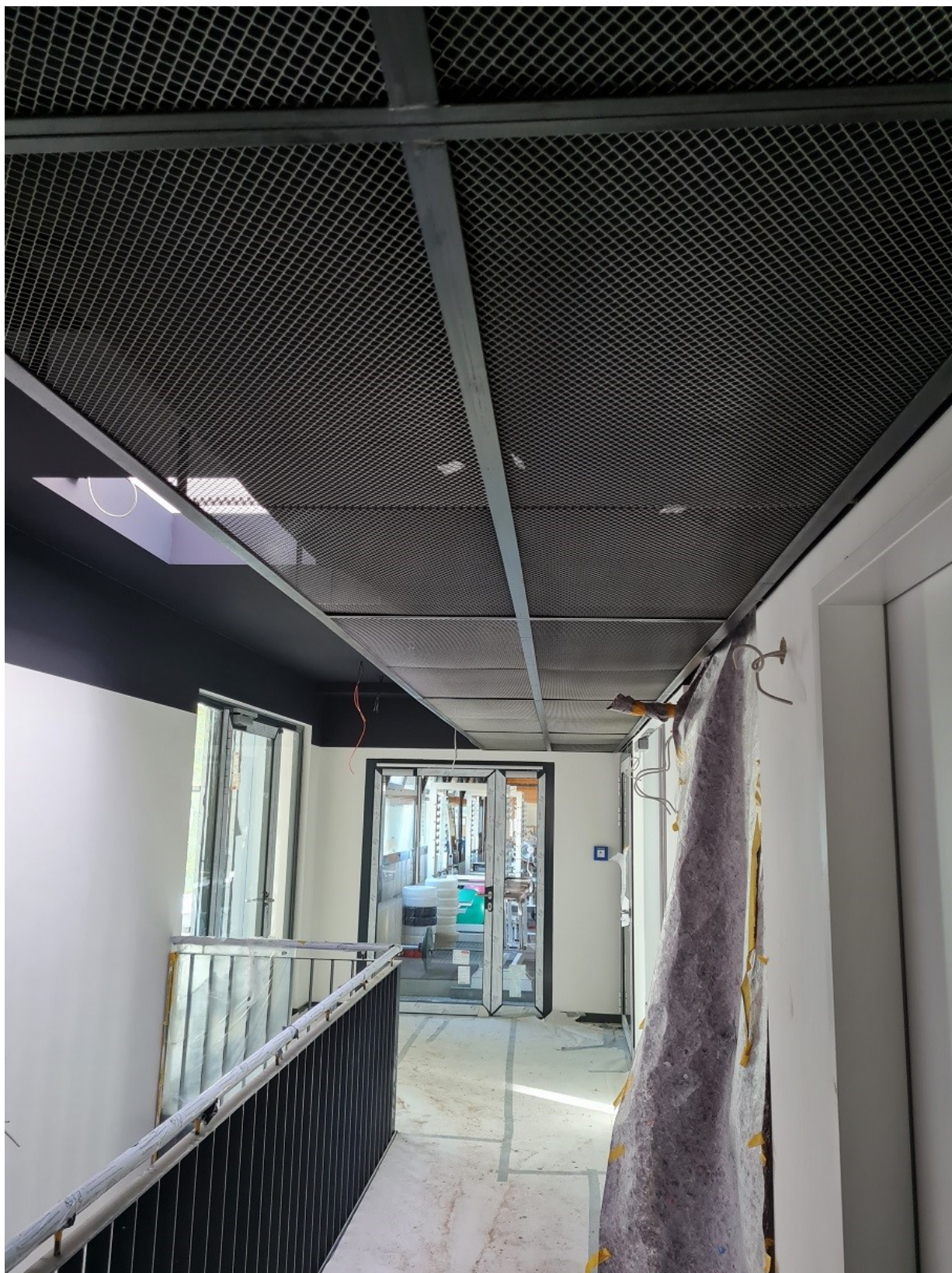
Abbildung 13: Streckmetalldecke im Übergang Altbau/Sporttrakt