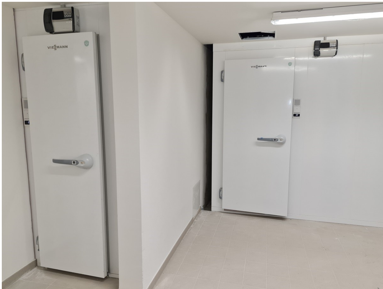
Abbildung 5: Ansicht Heizungszentrale