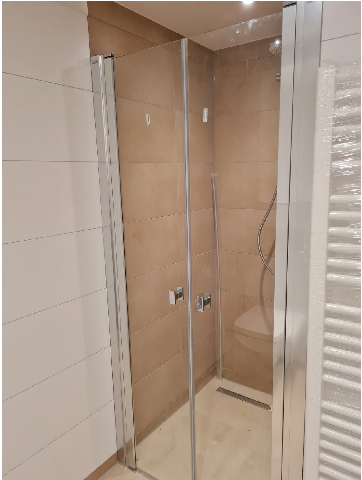
Abbildung 11: Duschen im Sporttrakt