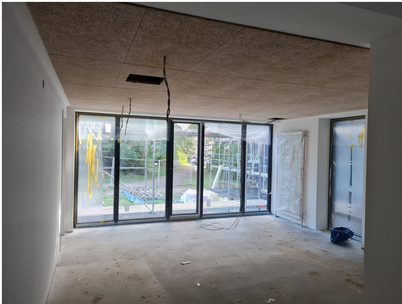
Abbildung 10: Social Base