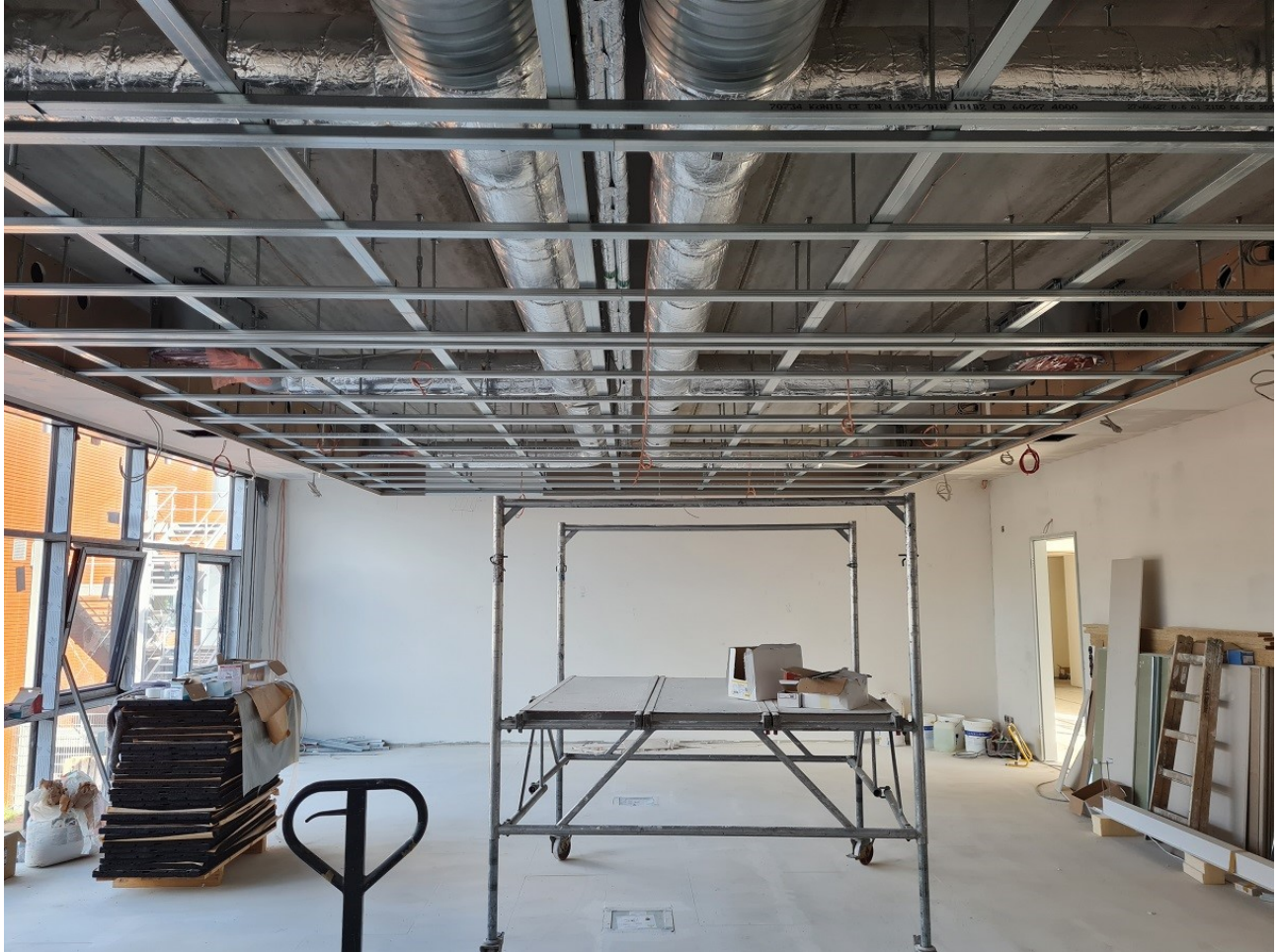
Abbildung 12: Abhangdecke in Aula