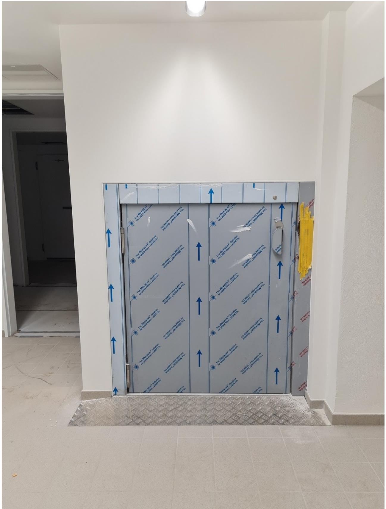
Abbildung 6: Lastenaufzug