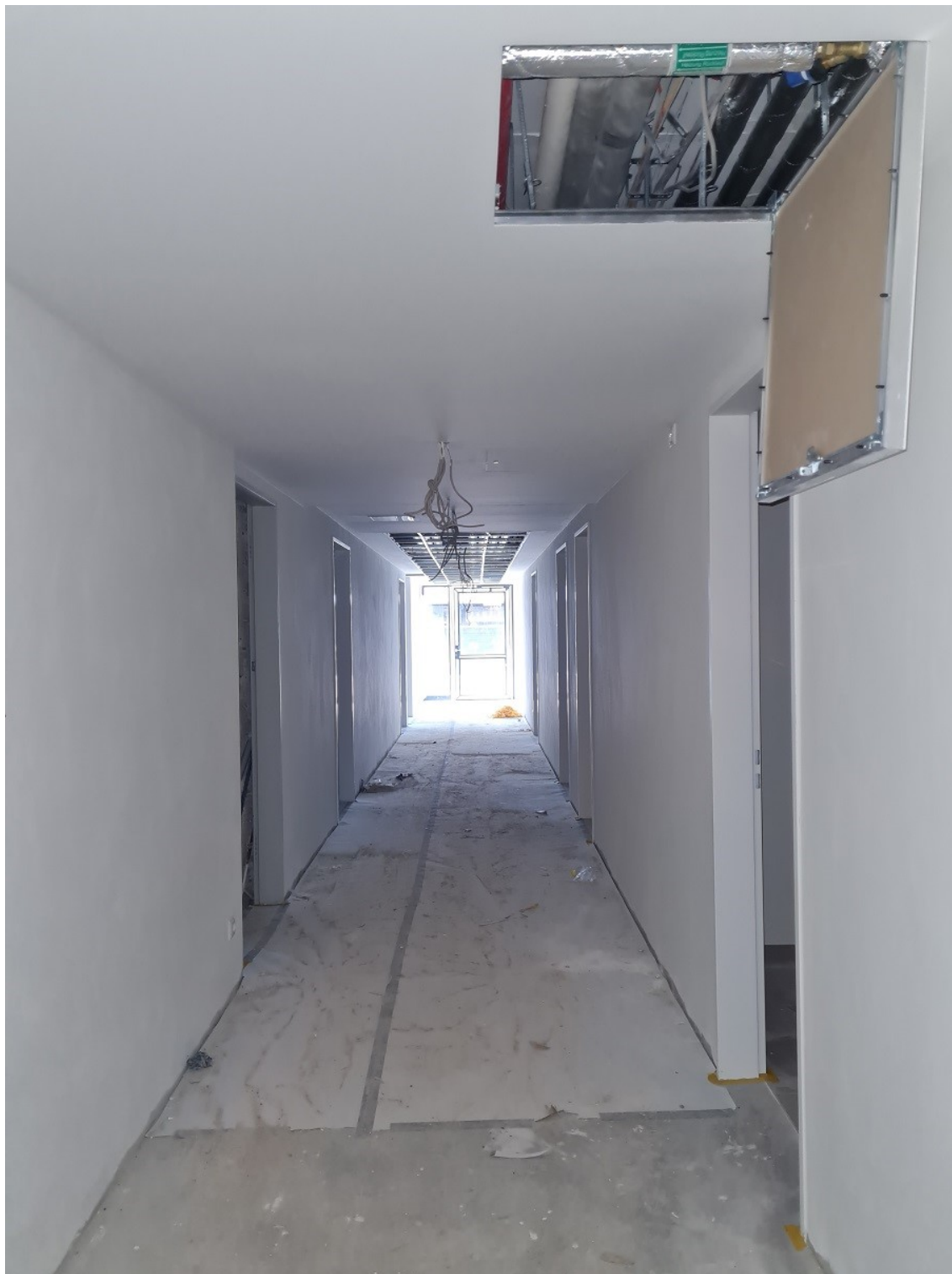
Abbildung 4: Wohntrakt, aktueller Fertigstellungsstand