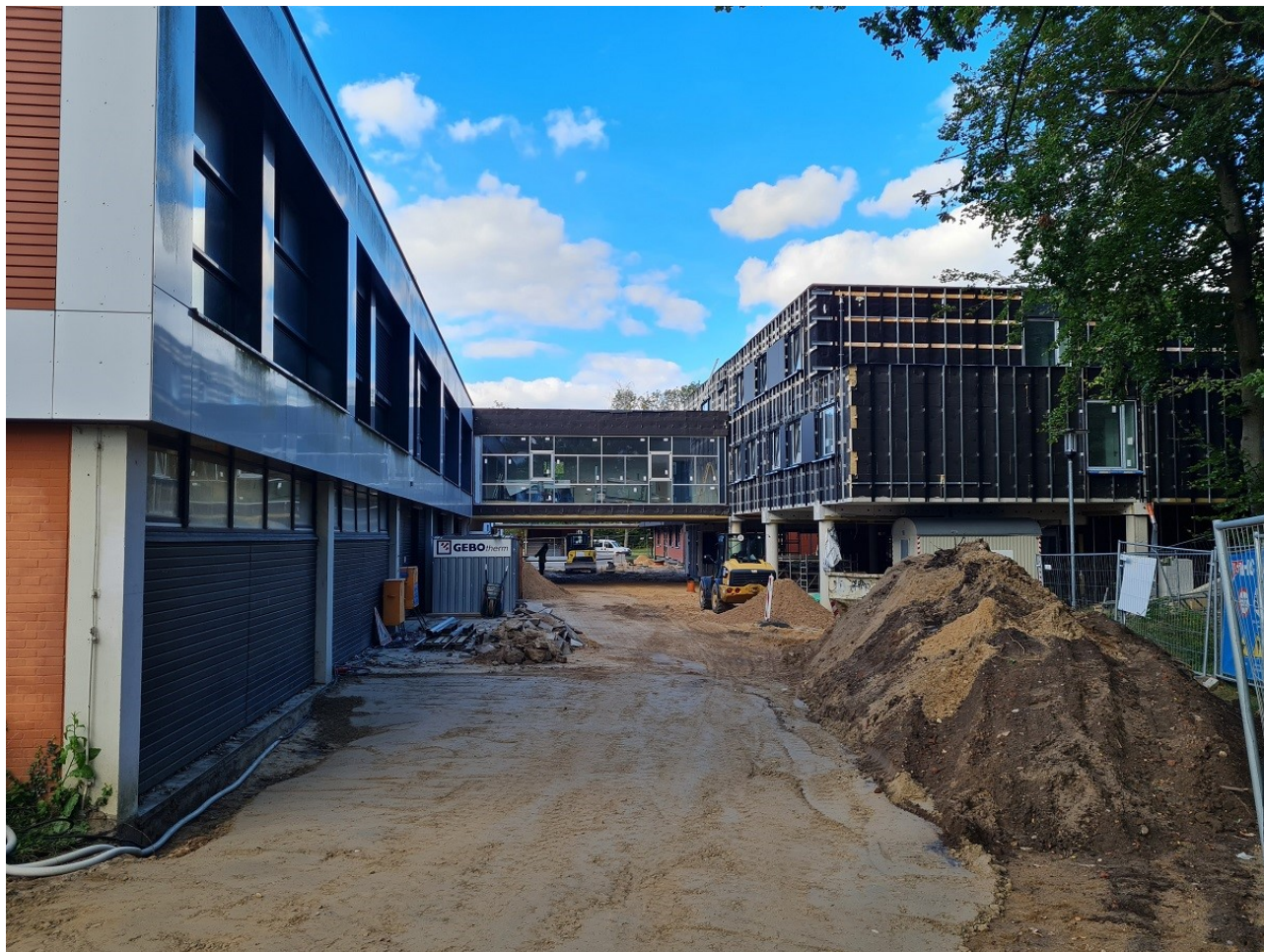
Abbildung 1: Zufahrt Innenhof mit Vorbereitung der GaLa Arbeiten

In diesem Abschnitt werden regelmäßig Bilder und Eindrücke aus der Planung bzw. dem Bauvorhaben festgehalten. Nachfolgend wird der Baufortschritt nach den Abbrucharbeiten dargestellt: