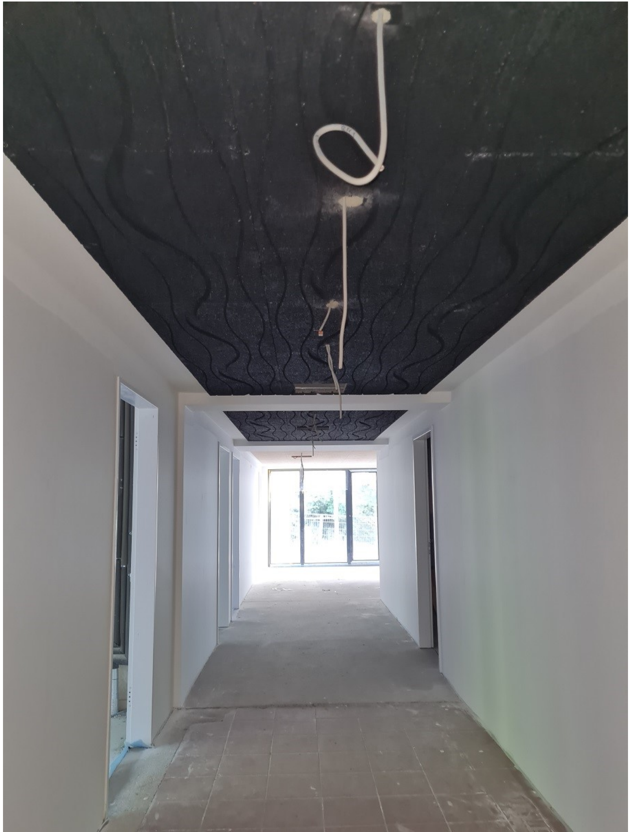
Abbildung 9: Flur Wohntrakt