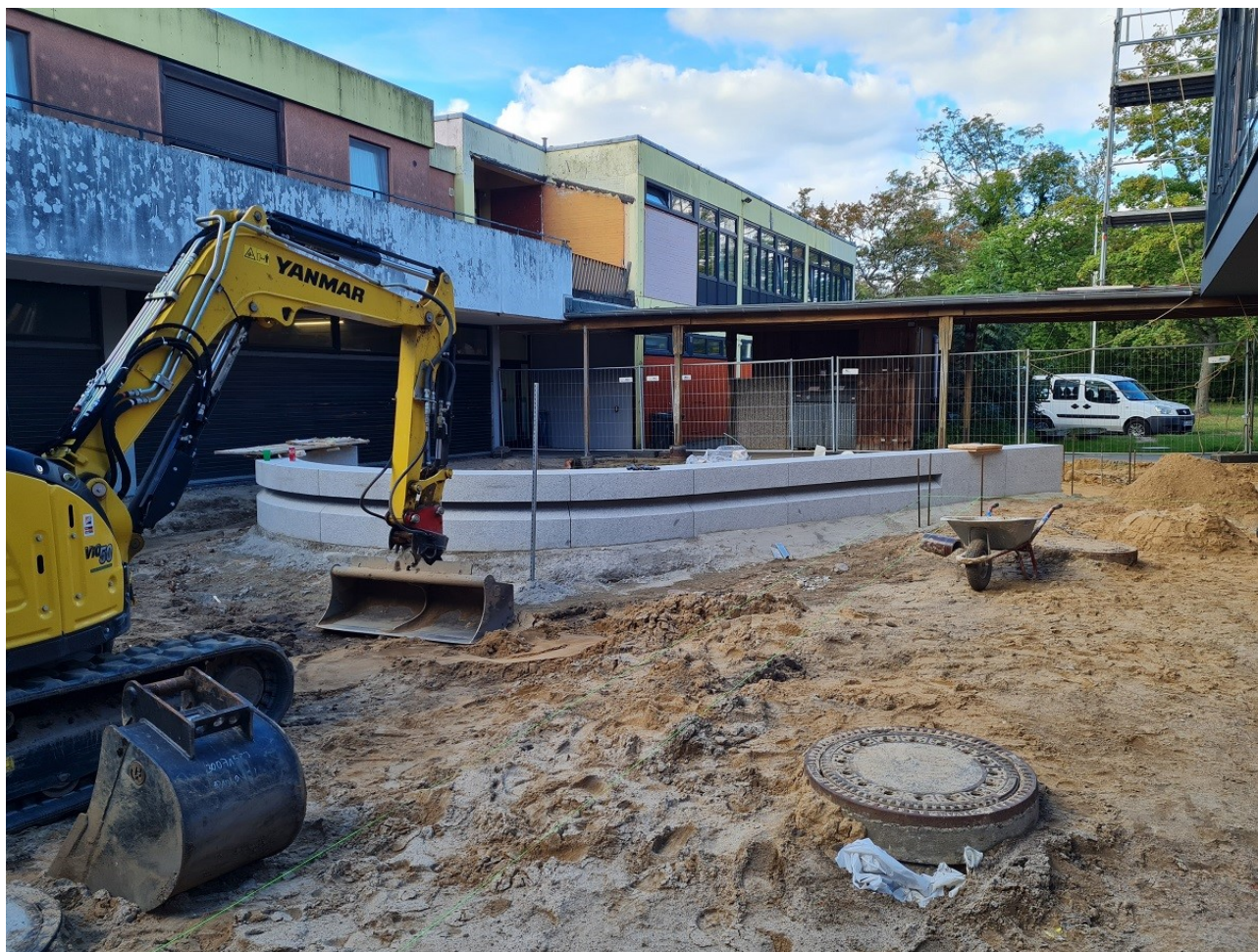
Abbildung 3: Gala Arbeiten auf dem Hof