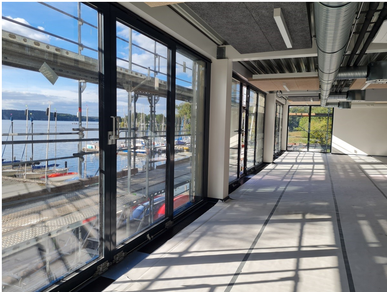
Abbildung 14: Sporthalle (Ruderraum)