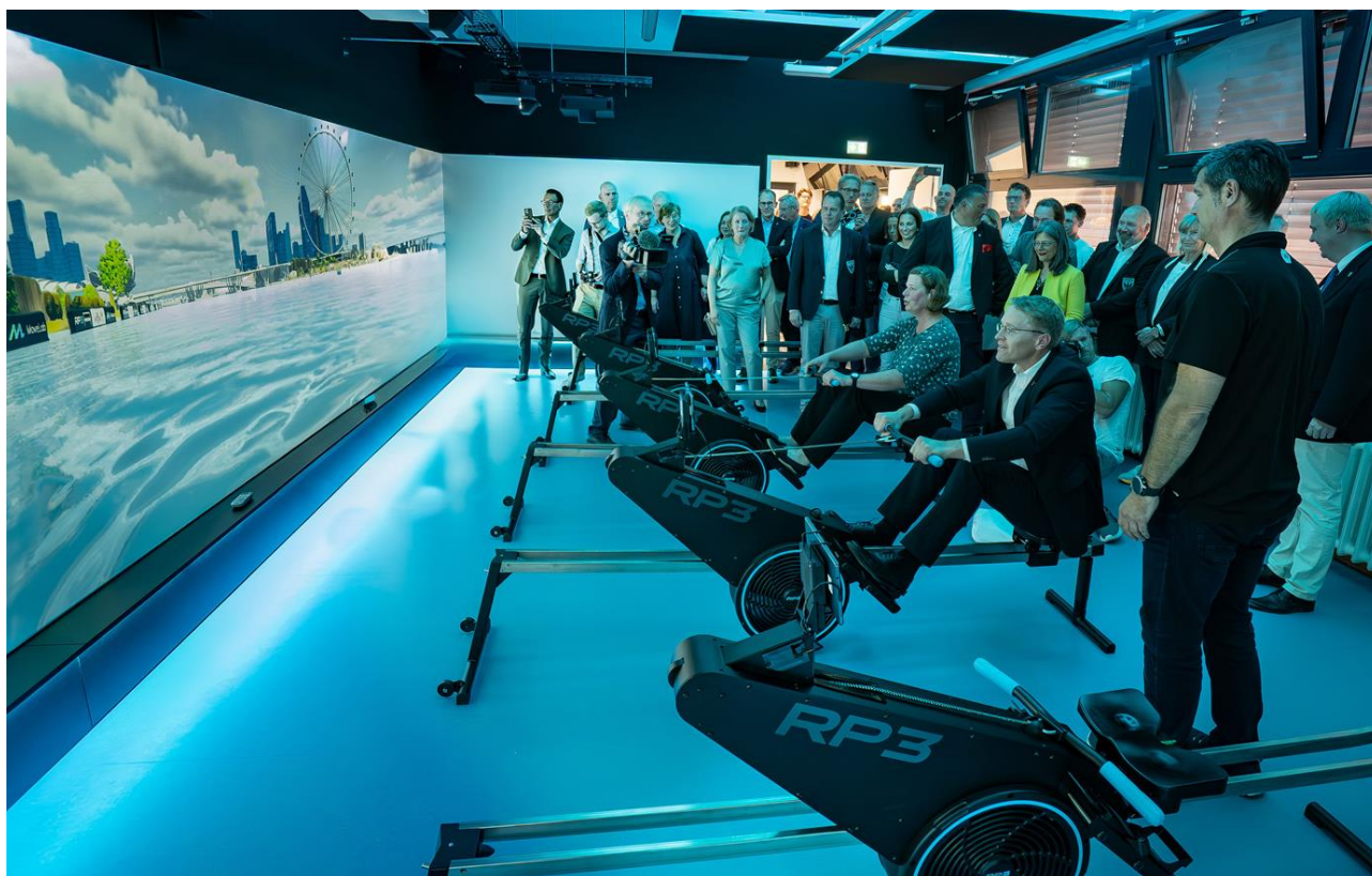
Abbildung 5: Probefahrt in der neuen Rowcave