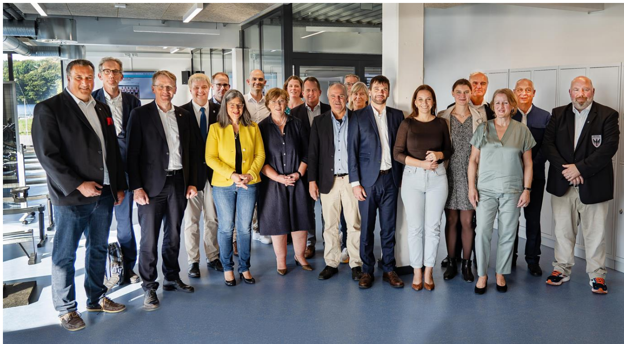
Abbildung 5: Gruppenfoto nach der ersten Teilführung