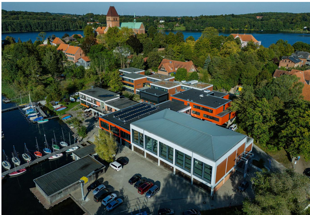
Abbildung 6: Luftaufnahme der neuen Ruderakademie