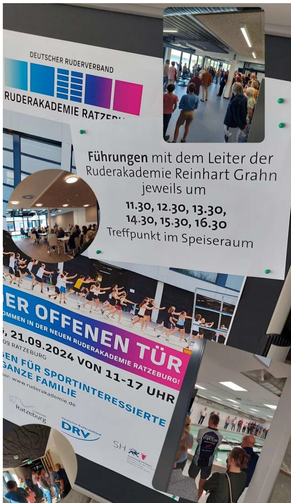
Abbildung 7: Eindrücke des Tag der Offenen Tür