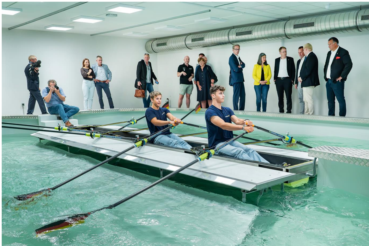
Abbildung 4: Besichtigung des neuen Rudermessbeckens