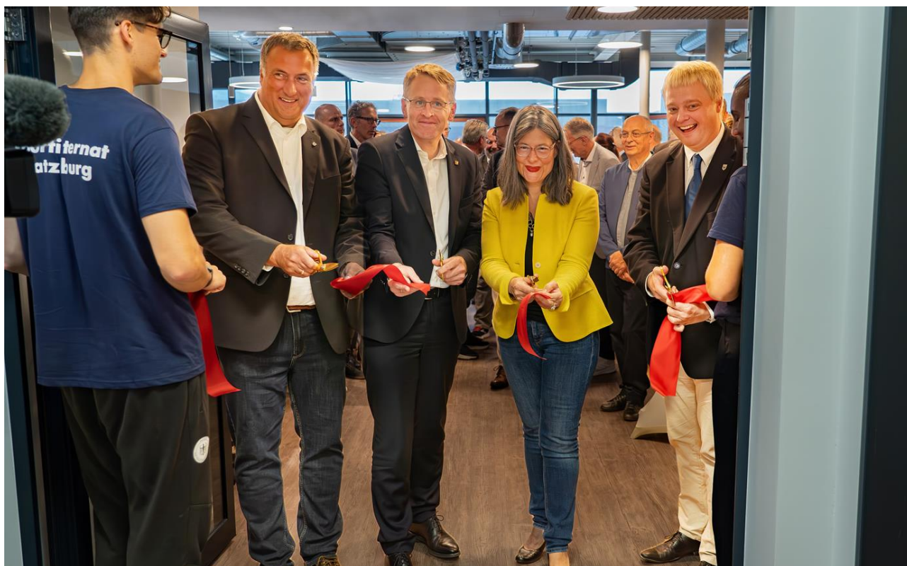
Abbildung 3: Durchschneiden des Roten Bandes