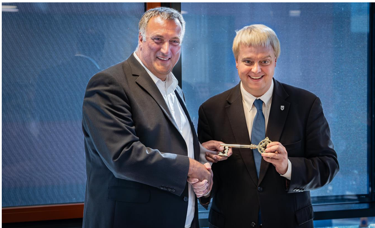
Abbildung 2: Überreichung des Schlüssels an den DRV