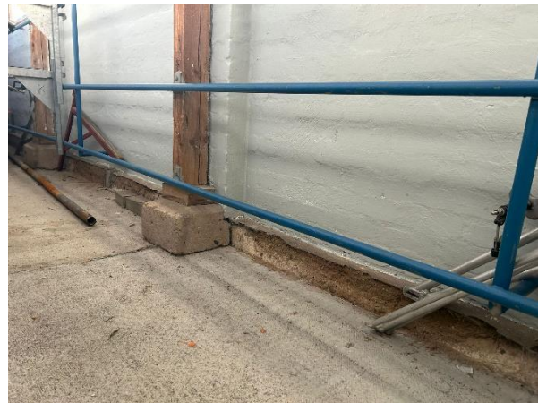
Dachboden über Bootshalle mit provisorischem Laufsteg zum „Zielturm“ (keine Regellasten!)