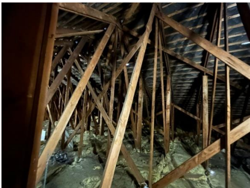
Dachstuhl über Clubraum mit abgehangter Decke