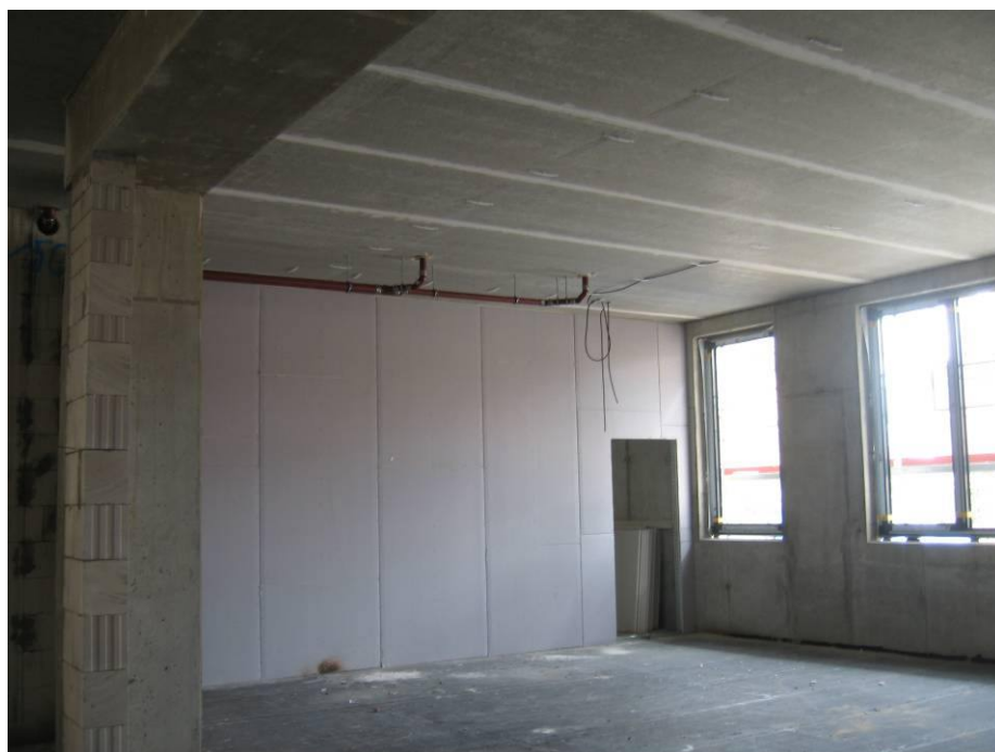
Trockenbau im Fachklassenbereich