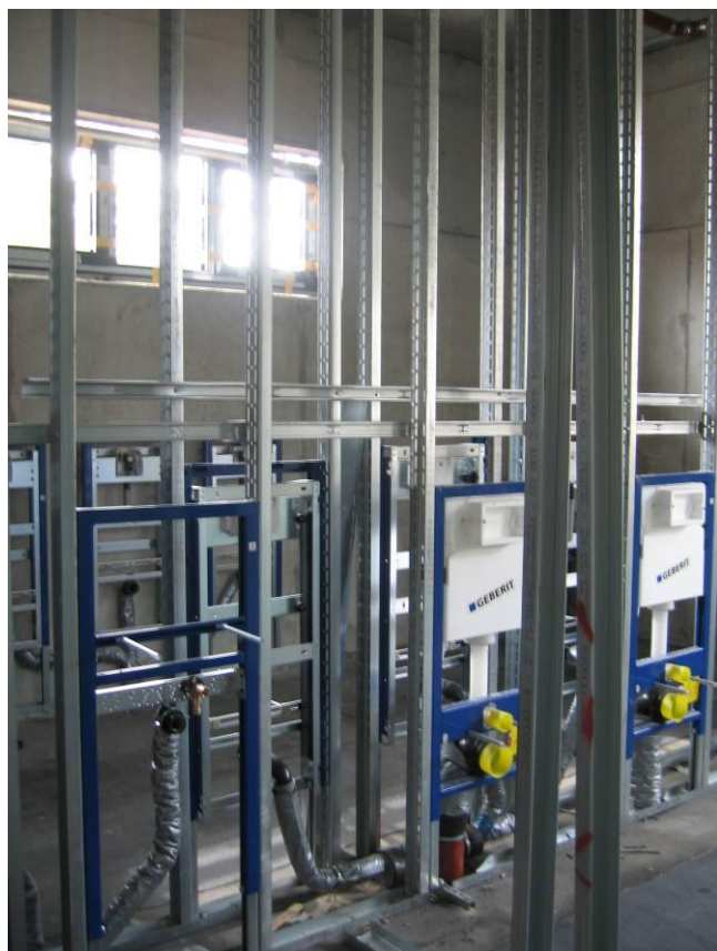
Installationsarbeiten im Sanitärbereich