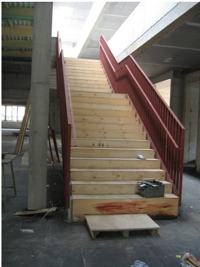
Haupttreppenanlage im Forum